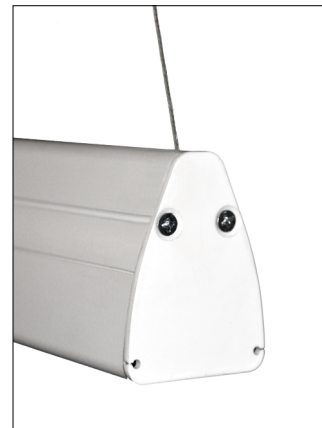
Trapézová zatěžovací tyč uzavírá tubus po celé jeho délce