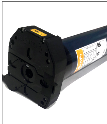
Bezúdržbový trubkový motor SOMFY splňující normu dle § 17 DGUV