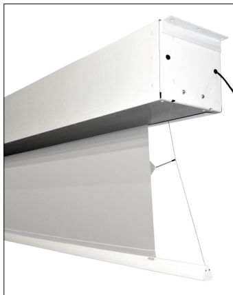
Vypínací systém zaručuje perfektní rovinnost projekční plochy