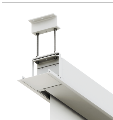
Vestavbový rám a projekční plochu lze montovat nezávisle