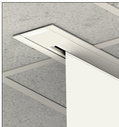
Komfortní a opticky čistá vestavba do podvěšených stropů